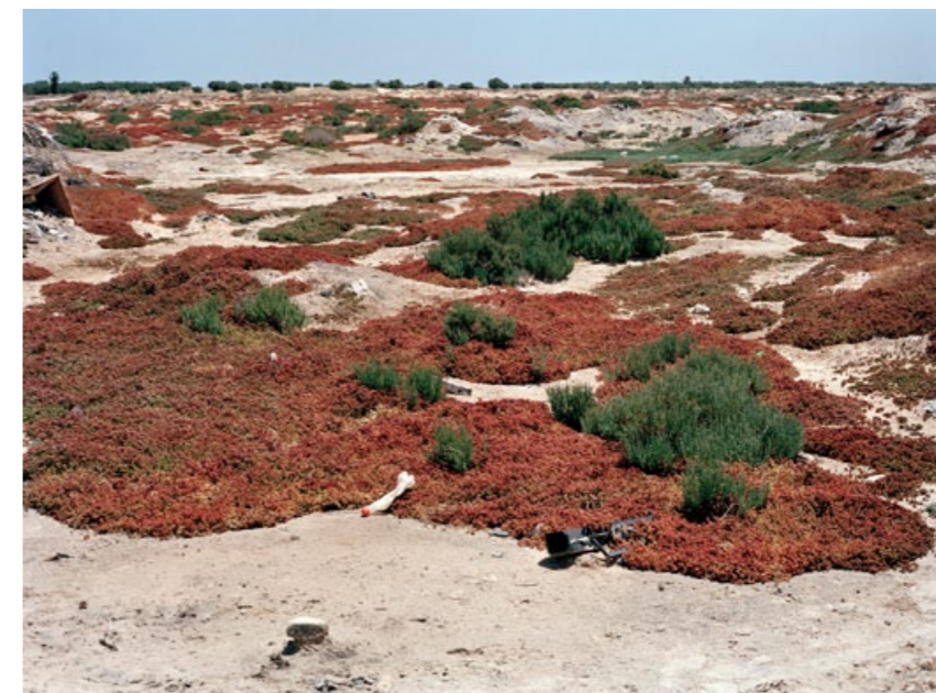
Disparitions – Zarzis, Tunisie, 2012

De haut en bas : Bateau échoué Filets Fosse commune