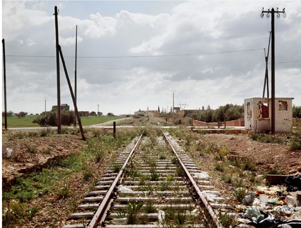
Vers Oujda et la frontière marocco-algérienne, 2007