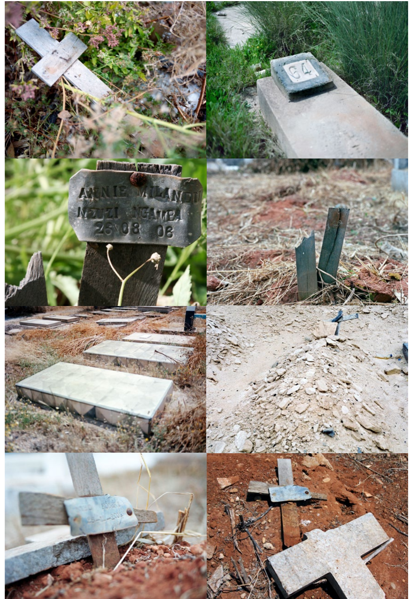
Tombes Rabat, Oujda – Maroc, Nouadhibou – Mauritanie, Sousse – Tunisie, 2009 - 2012